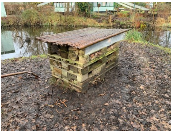
Insectenhotel de vijver