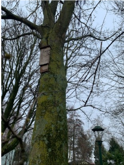
Vleermuizenkast de Molen