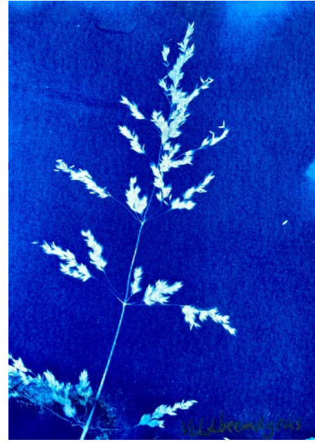
Cyanotype: vrolijk gras uit eigen tuin