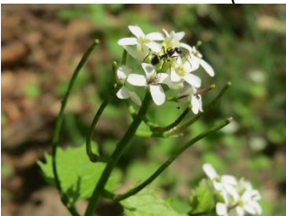
Look-zonder-look ( Alliaria petiolata )