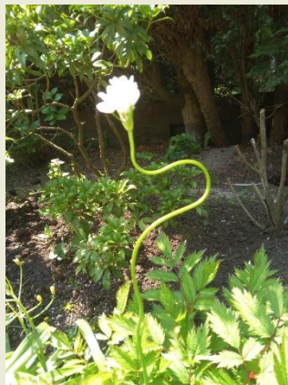
Look zonder look